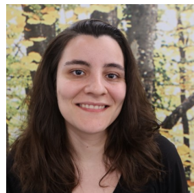
Sofia Tècnica de personal